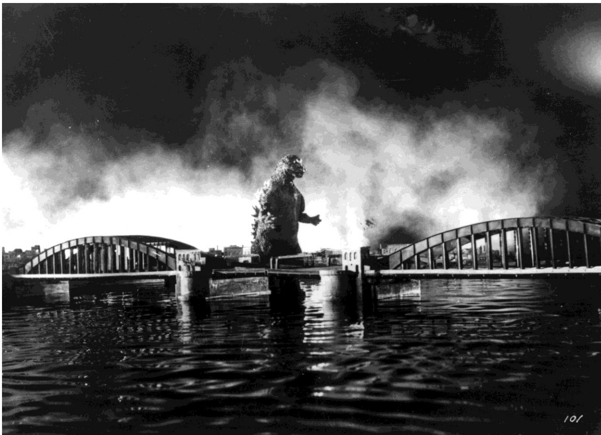
Gojira prestes a destruir a ponte Sukyia enquanto a cidade pega fogo.

isso, quando Gojira a destrói, ele está tirando dos cidadãos de Tóquio “a principal marca das perdas sofridas durante a guerra” 396 .