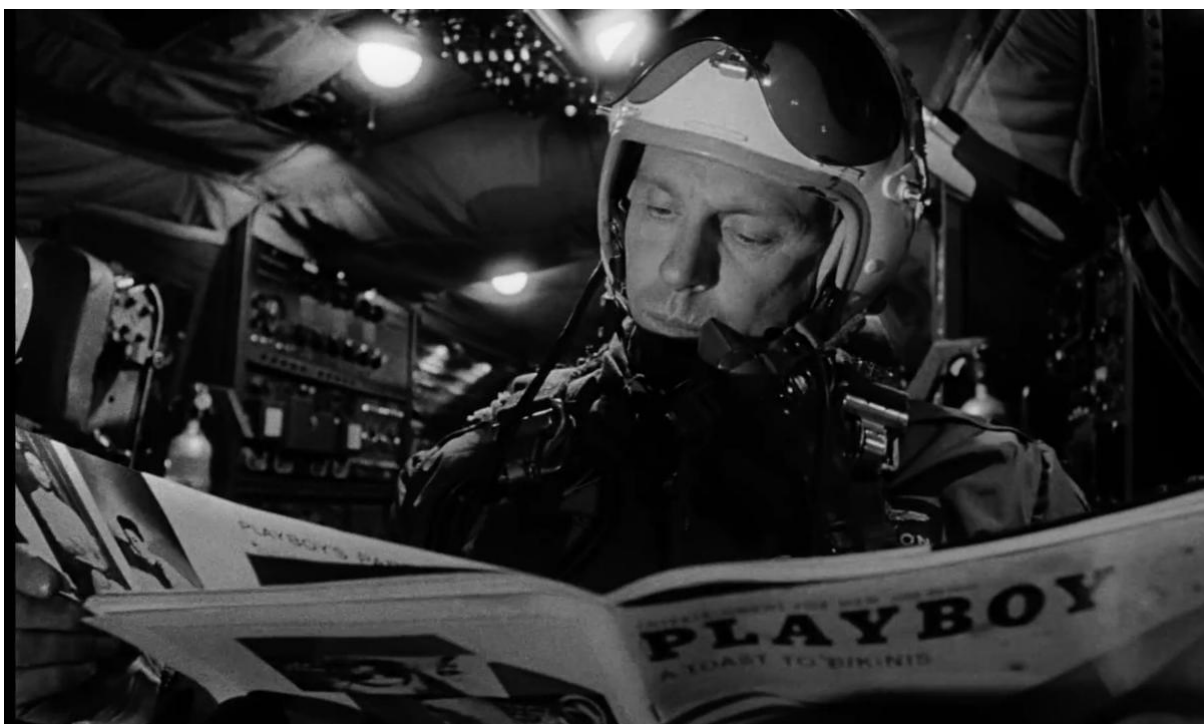
Oficial da Força Aérea lendo uma revista Playboy durante o serviço.

Foreign Affairs ser o único objeto responsável por cobrir a nudez da modelo para o público. Insinua-se assim que por trás dos graves “ foreign affairs ” que constituem o conflito figuraria, mal encoberta, uma temática sexual. Os outros membros da tripulação também são apresentados de maneira secular, entretidos com pequenos prazeres do cotidiano. Há quem jogue cartas, há quem leia um livro enquanto se alimenta, há quem tire um cochilo. Todo esse movimento lento do que parece ser um dia comum entre os militares é interrompido pela chegada de uma mensagem codificada.