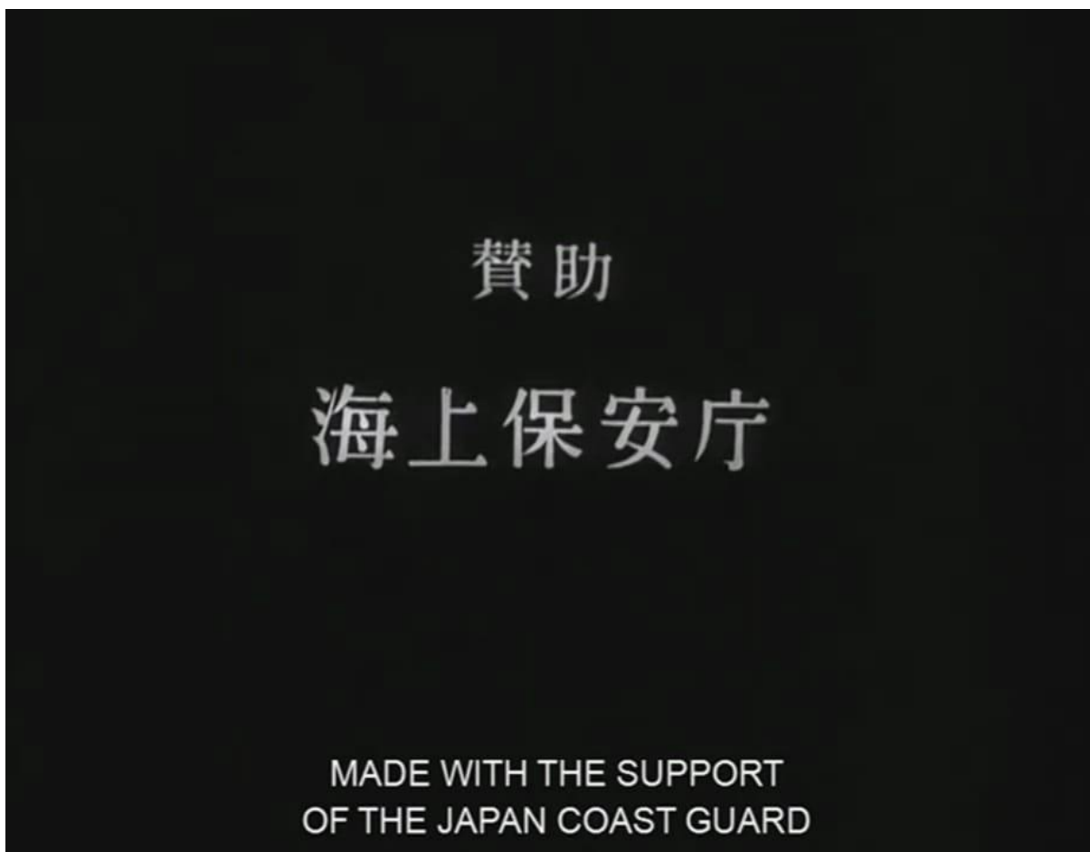
Gojira e a Guarda Costeira do Japão.

Com uma nota de reconhecimento/agradecimento à Guarda Costeira do Japão pelo suporte na realização das filmagens se inicia a projeção de Gojira (1954). O que poderia parecer irrelevante, trivial até, revela aspectos importantes da nova ordem estabelecida no Japão com o fim da Segunda Guerra, o estado em que se encontram as instituições japonesas no pós-guerra.