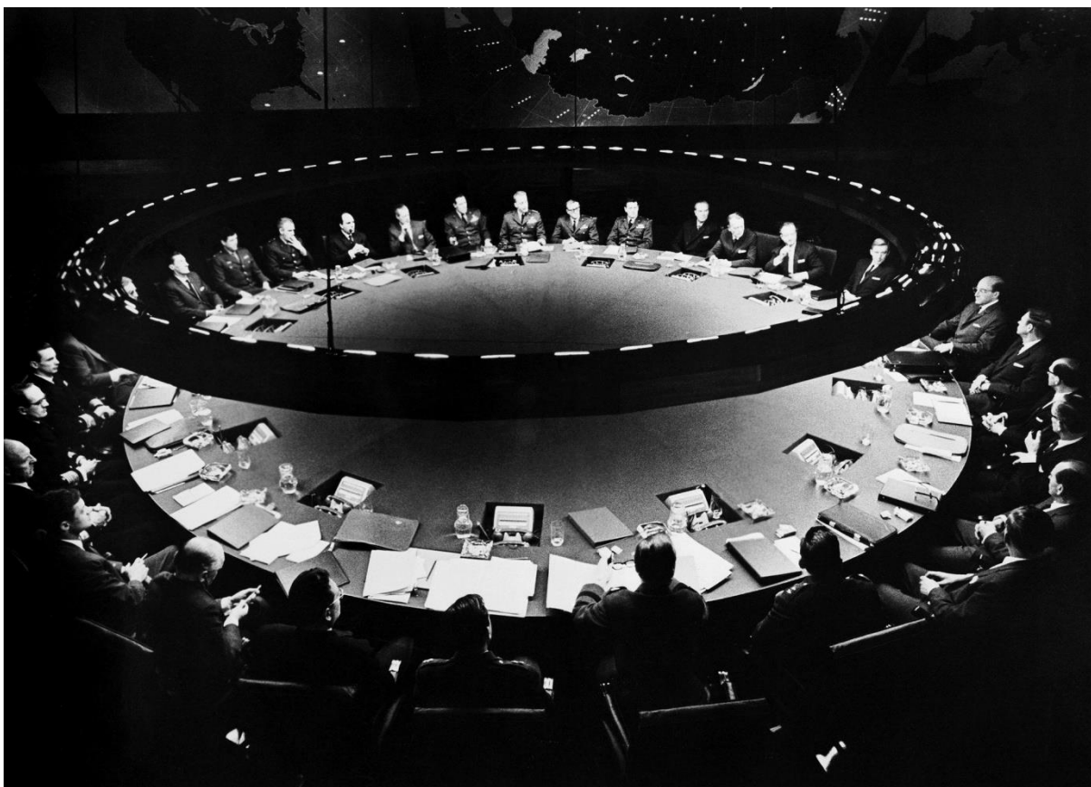
Mesa de reunião na Sala de Guerra.

Em se tratando da Sala de Guerra, a primeira coisa que podemos notar é a mesa em volta da qual se reúnem o presidente e seu staff . A mesa não impressiona apenas por seu tamanho, capaz de reunir ao seu redor algumas poucas dezenas de homens, mas também pelo material com o qual foi coberta. Por ter sido filmado em preto e branco, Dr. Strangelove não nos permite saber que o tecido que cobre a mesa é verde, conforme um pedido direto de Kubrick a Ken Adam. De acordo com o relato de Adam, Kubrick o pediu para acrescentar esse detalhe mesmo sabendo que passaria imperceptível para os espectadores, mas daria para os atores o sentimento, criaria a atmosfera, de estarem reunidos numa gigantesca mesa de poker 565 . Nessa mesa o que estava em disputa era o destino do mundo.