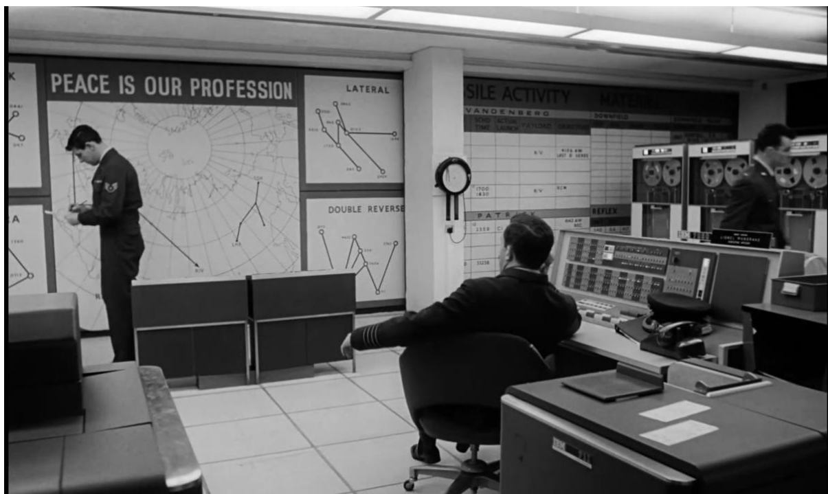
Capitão Mandrake no que parece ser a sala de inteligência da base aérea.

personalidade mais racional e comedida e a ligação concreta que tem com outras pessoas; o General Ripper se encontra sozinho em seu escritório, um espaço bem mais estreito e mal iluminado, cercado por quadros e gravuras que fazem referências ao campo militar – o que apontaria para a obscuridade por detrás de suas ações, uma personalidade inescrutável, beirando o sombrio, em razão de sua sisudez, além da sua desconexão com outras pessoas e proximidade com o bélico. O que conecta ambos é o lema do Strategic Air Command (SAC) ao fundo, “ Peace is our profession ” 510 . Com o soar da sirene que anuncia o estado de alerta vermelho na base aérea, Ripper se levanta, parece consternado, vai até a janela e fecha as persianas, diminuindo ainda mais a quantidade de luz no cômodo, e reforça seu isolamento. A base se fecha ao mundo, o general reproduz a ação numa escala bem menor, simbólica, individual.