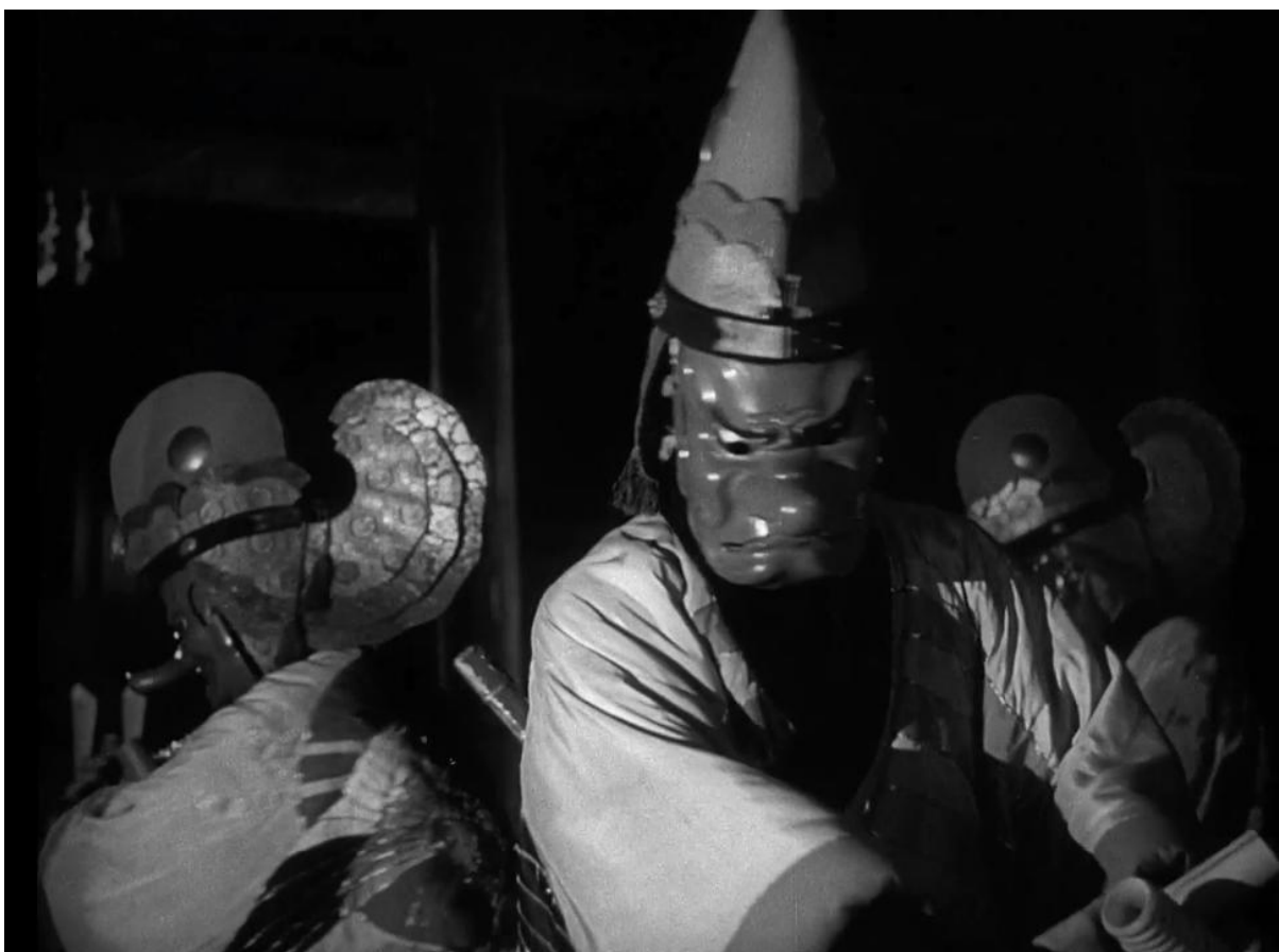
Dança cerimonial capaz de “exorcizar” a presença de Gojira.