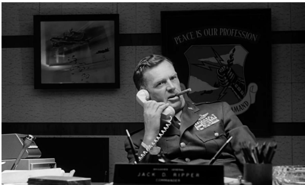
General Jack D. Ripper em seu escritório.

pergunta se refere à confirmação do posicionamento dos aviões estadunidenses, aqueles que estão sempre no ar, preparados para atacar alvos soviéticos. Uma vez que as respostas de Mandrake são positivas, Ripper lhe informa que a base entrará em “alerta vermelho”. O capitão interpreta a ordem como um exercício militar, mas este não é o caso. O general informa, porque considera que Mandrake tem o direito de saber, que estavam em guerra. Perplexo diante do informe, Mandrake pergunta se há envolvimento dos russos no combate; Ripper diz não saber mais que isso. Antes de encerrarem a conversa, General Ripper direciona o capitão a transmitir o plano R para um grupo de bombardeiros atômicos. Por último, e talvez o mais importante, de acordo com o general: “Confisquem todos os rádios particulares imediatamente”. Assim, não haveria possibilidade do inimigo, no exterior da base, se comunicar com sabotadores infiltrados.