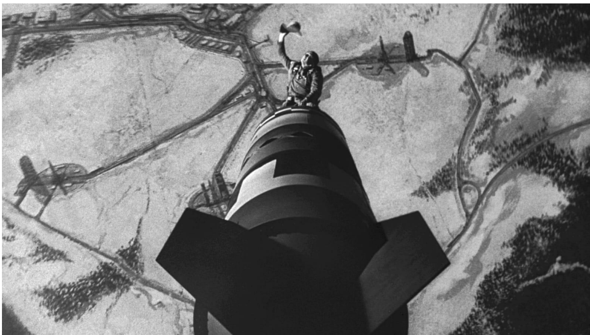
O cowboy Kong monta alegremente o foguete que destruirá o mundo.

Após contemplarmos a nuvem de cogumelo, tipicamente relacionada à explosão nuclear, vemos surgir das sombras a figura do Dr. Strangelove. O cientista, aparentemente feliz com o desenrolar das coisas, fala sobre a possibilidade de preservar um pequeno núcleo da espécie humana em minas subterrâneas, onde a radioatividade não penetraria e onde poderiam sobreviver pelos próximos 100 anos. O cientista comete o ato falho de chamar o presidente americano de “ Mein Führer ”. Ninguém parece dar muita atenção a isso. De fato, conforme aponta Noam Chomsky, os Estados Unidos não pareciam se importar muito com qualquer mácula que um passado abertamente nazista poderia ter deixado em seus associados; pelo contrário, há a possibilidade do passado fascista ser um dos critérios para a aliança, pois os métodos que esses homens conheciam e operavam por anos agora seriam úteis ao Tio Sam na luta contra o socialismo 591 . O braço e a mão direita de Dr. Strangelove, membros deficientes, involuntariamente passam a performar a famigerada saudação nazista. Novamente, isto é ignorado por todos os presentes na sala. De acordo com Louise Pinto: