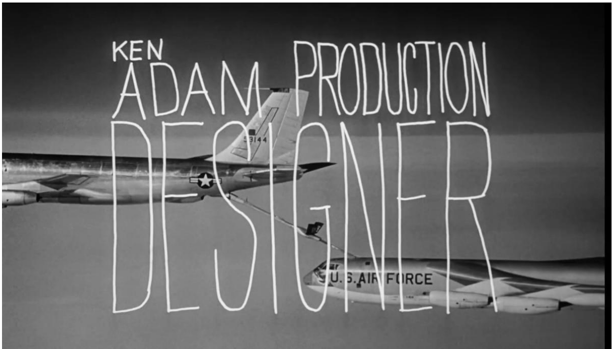
Abastecimento do tanque de combustível de um bombardeiro B-52 em pleno voo.

Enquanto atualmente os créditos dos profissionais envolvidos num projeto fílmico em geral aparecem apenas após toda exibição da narrativa já ter sido projetada, ainda era comum, nos anos 1960, termos este processo invertido. Na Hollywood clássica, os realizadores eram reconhecidos com primazia em relação à narrativa que haviam construído.