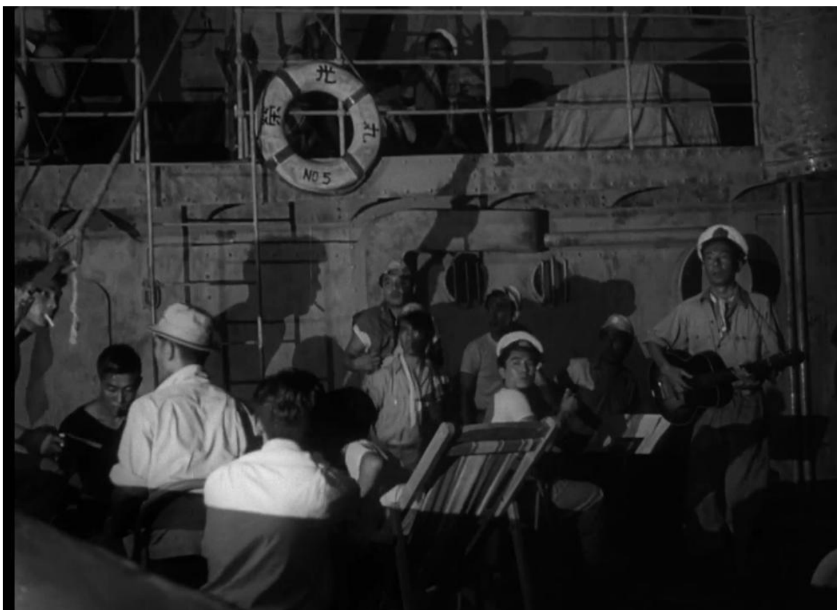
Um clarão vindo do mar surpreende os tripulantes do navio.

ameaça, apenas outro clarão que vem das profundezas do oceano. O que se segue é uma correria dentro da embarcação acompanhada de gritos de desespero e assombro. Os instrumentos são abandonados, a música calma é substituída por uma nova melodia, mais grave. O navio pega fogo enquanto dois de seus tripulantes, aparentemente os responsáveis pela comunicação, enviam um pedido de socorro à terra firme.