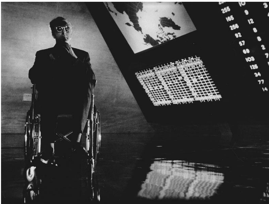
Dr. Strangelove surgindo das sombras.

Desta maneira, vemos as duas potências chegando aos extremos sem a possibilidade de recorrerem à política e à diplomacia como árbitros do conflito. A velocidade de resposta se tornou elemento tão importante e decisivo na guerra do século XX que a única saída racional encontrada pelas personagens de Dr. Strangelove foi entregar o destino do mundo a uma máquina. Paul Virilio, comentando acerca do que chama de Guerra Pura e o que é viver sob a ameaça nuclear, tece comentários perspicazes: “Quando houver menos de um minuto para decidir se se aperta ou não o botão do pânico, teremos atingido um limite, que é o da automação da guerra. A decisão em favor da guerra ou da paz pertencerá a uma máquina automática de resposta!” 588 .