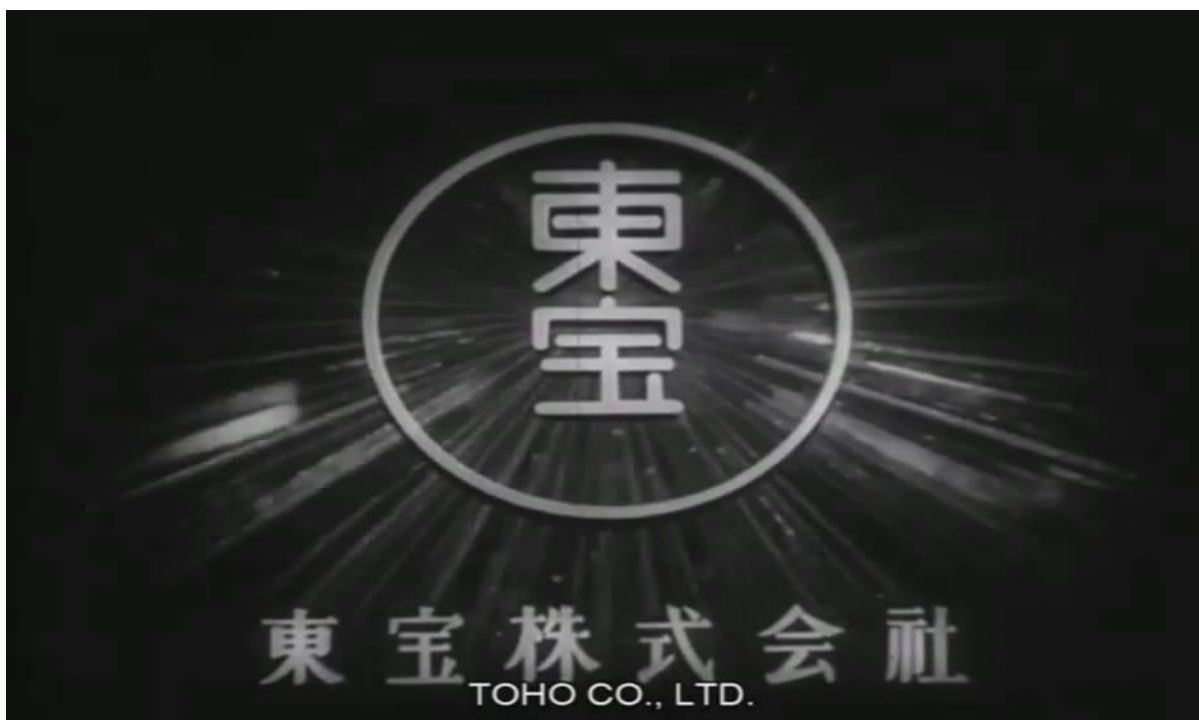
Logotipo da Toho no início de Gojira .