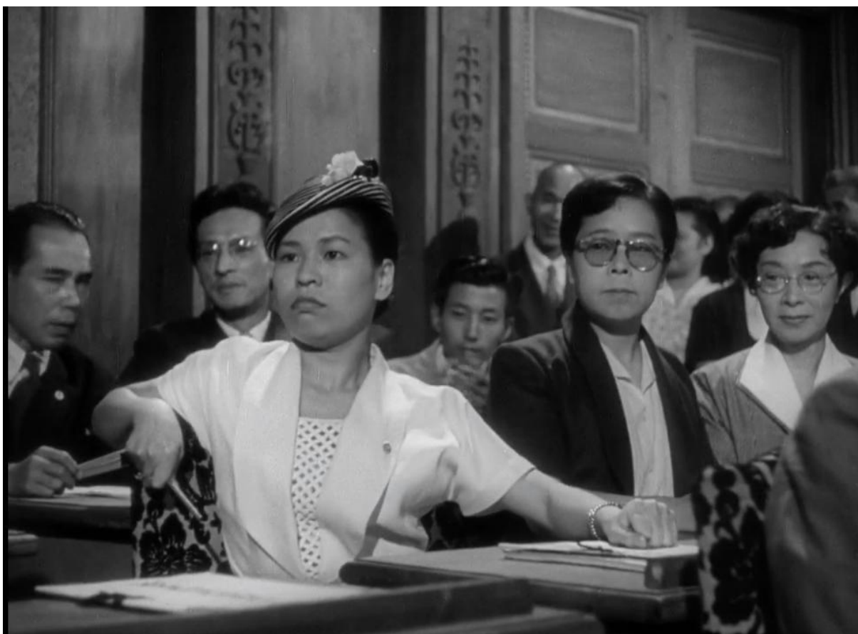
Mulheres lutando pelo acesso do povo à informação.

pelos estrangeiros. O projeto de democratização da sociedade japonesa passava por rever o papel da mulher neste contexto. A partir de uma observação mais próxima, os americanos chegaram à conclusão de que a mulher japonesa era “vítima de uma antiga herança que a tornava inferior em relação ao homem em todas as esferas, pública ou privada” 377 . Sendo assim, os filmes passaram a ser incentivados pelo CIE a representarem as mulheres enquanto personagens independentes, capazes de tomarem suas próprias decisões, imbuídas de valor e de dignidade semelhante aos homens 378 .