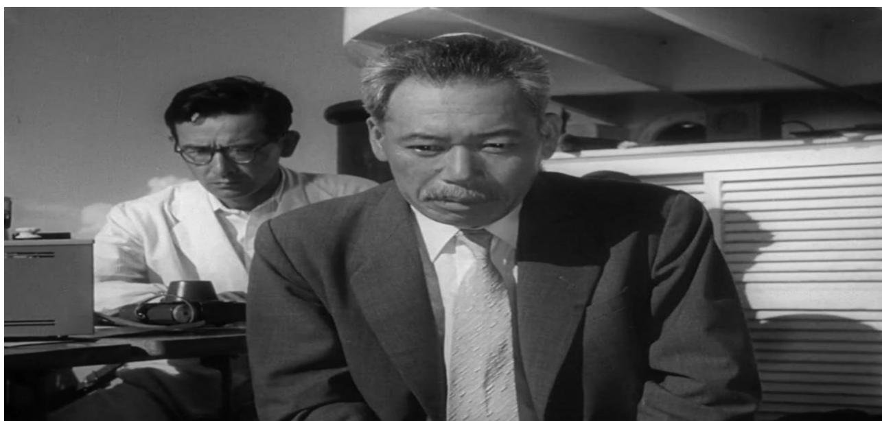
Professor Yamane e seu olhar perdido após o uso nova da arma.

Por fim, vemos o professor Yamane devastado pela perda. A perda daquele que seria seu futuro genro e também a perda de Gojira: “Não consigo acreditar que Gojira era o último de sua espécie. Se os testes nucleares continuarem, então algum dia, em algum lugar do mundo, outro Gojira poderá aparecer”. No discurso pacifista de Yamane, que fecha o filme, Gojira passa a representar não somente a ameaça atômica dos EUA ao Japão, mas uma ameaça nuclear mais abrangente que poderia sobrevir a qualquer outra nação. O peso dramático da fala do professor repousa no temor que ela quer provocar: no cenário descrito, todos estão vulneráveis e são vítimas em potencial da aniquilação – outro “Gojira”, com ou sem aspas, poderia aparecer em qualquer lugar do mundo, caso a ameaça nuclear prosperasse.