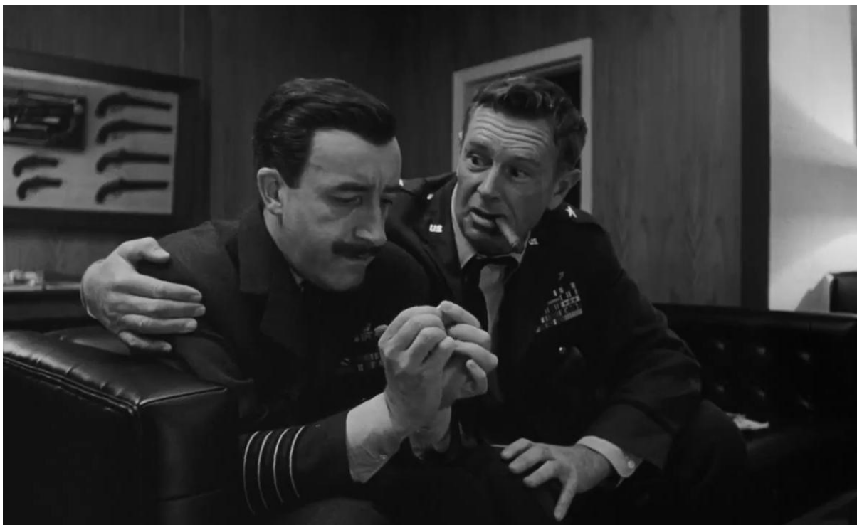
O general Ripper revela ao capitão Mandrake sua incrível descoberta.

Conforme nos relata Sousa, a realidade pode ser tão estranha quanto a ficção. Com isso, queremos dizer que essa parte da história pode não ter sido uma ideia original dos roteiristas. Em 1957, a Sociedade John Birch, grupo de direita dos Estados Unidos, difundiu por meio de carta a teoria conspiratória de que a fluoretação da água seria a “materialização da estratégia comunista de dominação” 572 . O documento que o grupo fez circular também contava com acusações mais comuns contra comunistas, “como traição à pátria e interferência nos assuntos da vida privada” 573 .