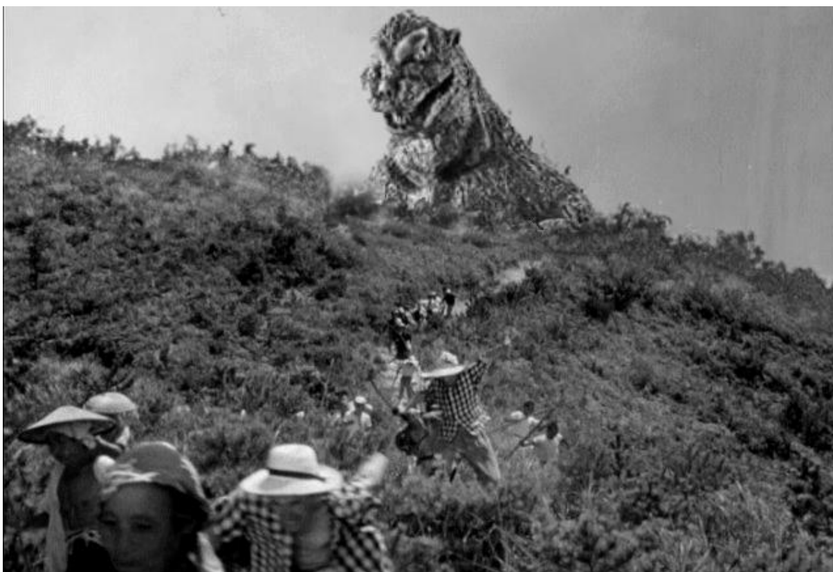
Gojira põe em fuga a multidão enfurecida que vinha para enfrentá-lo.